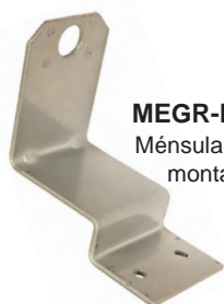
MEGR-RVB Ménsula de montaje en L

* Configuración: 100 PSIG de entrada a 2 PSI de salida fluyendo a 30 SCFH de aire