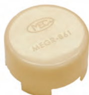
MEGR-861 Tapón de primera etapa