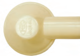
MEGR-862 Tapón de segunda etapa